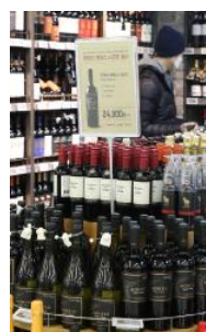
Bottiglie in esposizione

Anche per Albino Armani, presidente del Consorzio vini doc delle Venezie e a capo dell'azienda Armani di Dolcè crescono le preoccupazioni, non solo per l'Ucraina ma soprattutto per il mercato russo e i Paesi vicini, «popolazioni con una vitalità enorme, che hanno voglia di scollarsi di dosso il passato e in cui vedevamo un mercato tonico, che potrebbe dare grandi risultati. I vini veneti e veronesi sono indubbiamente esposti. In queste condizioni bloccheranno i pagamenti; ora siamo appesi alla spada di Damocle del conflitto ma anche alla svalutazione del ru-